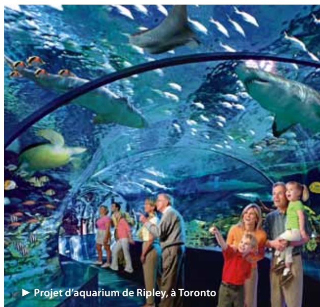
► Projet d'aquarium de Ripley, à Toronto