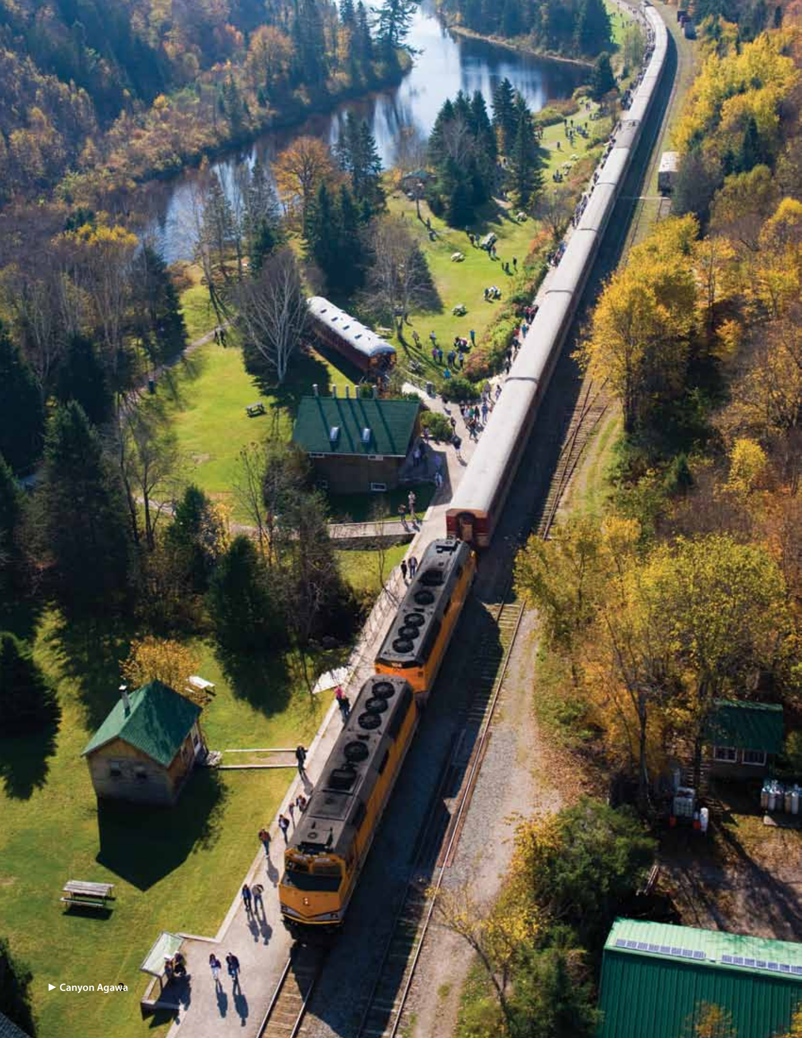
► Canyon Agawa