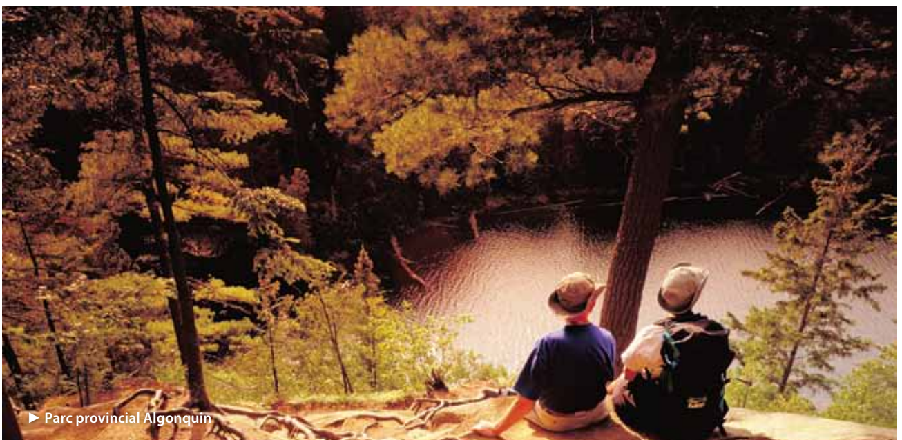
► Parc provincial Algonquin

Le renforcement du secteur du tourisme accroît la productivité de notre économie, crée des emplois et améliore notre qualité de vie. 1